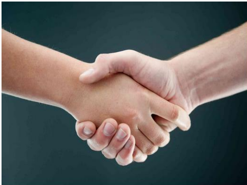
Freundschaftlicher Händedruck