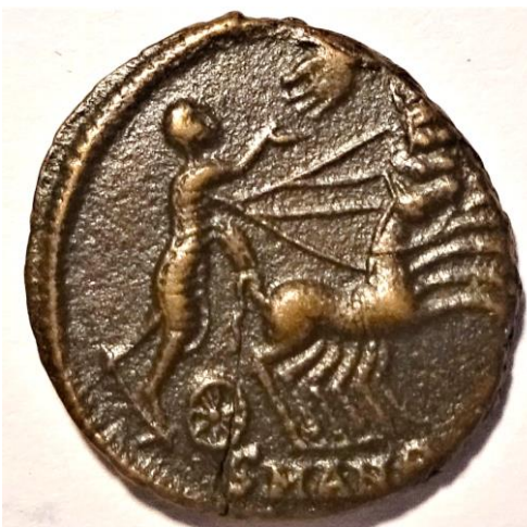
Constantinus I. im Viergespann streckt seine Hand aus zu Gottes Hand im Himmel. Münzprägung nach dem Tode von Kaiser Konstantin.