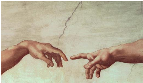
Michelangelo: Gott erschafft Adam. Sixtinische Kapelle.