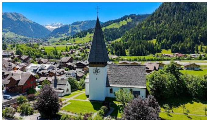
Mauritiuskirche in Saanen